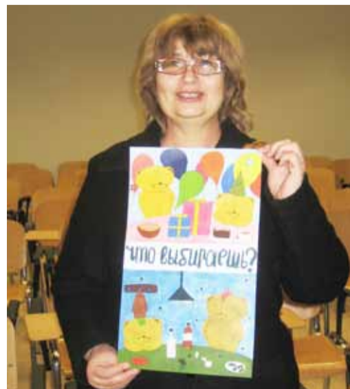
Venekeelse plakati võidutöö koos juhendajaga