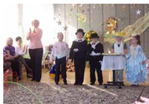
Tallinna Mustakivi Lasteaia 25. aastapäeva pidu.

inimene, elab – rõõmustab, kurvastab, usub, loodab. Lasteaia hing ja süda – need on õpetajad, õpetajate abid, kokad, medõed, puhtust ja korda jälgivad inimesed ning loomulikult juhtkond. Neid kõiki ühendab midagi erilist – nemad teavad saladust, miks aastast aastasse siia rõõmuga uued väikelapsed tulevad. Kõik muutub meie elus, kuid muutmatuks jää-