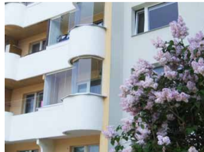
Ka keerulise kujuga rõdu on võimalik klaasida.

• Lodžasid ja rõdusid võib sulgeda ainult raamideta täisklaassüsteeme kasutades (v.a. juhul, kui enamus lodžadest või rõdudest on kinni ehitatud raamlahendusena ehitusloa alusel, siis tuleb kinniehitamist