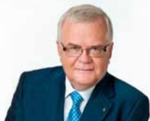
Edgar Savisaar Tallinna linnaepea

Läheneb 23. august, mälestusväärse Balti keti 25. aastapäev. Täna püüab Eestimaa Rahvarinde korraldatud ühisest suuraktsioonist 23. augustil 1989 esmajoones ülev ja uhke emotsioon. Kindlasti tuleb täna püüda tunnustada neid sadu ja tuhandeid organisatooreid, kes aitasid kaasa ürituse õnnestumisele. Nii mõnigi korraldaja oli neil aegadel jalul koguni üle 24 tunni järjest.