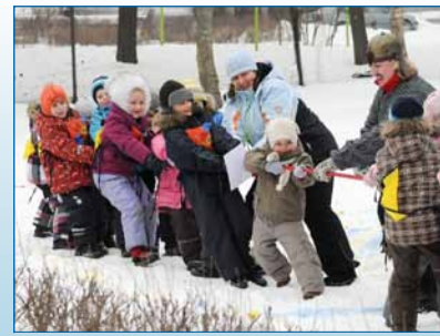
Lk 4 Taliolümpiamän- gud Arbu laste- aias