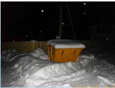
Lk 3 Prügi äraveost võib saada probleem