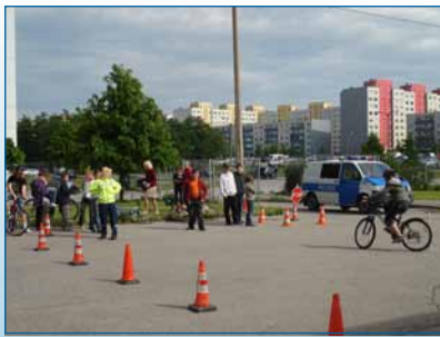
Lk 3 Jalgratturi juhi- load: tähelepanu- tasuta kursused!