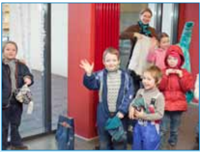
Lk 3 Lindakivi kutsub lastepeole!