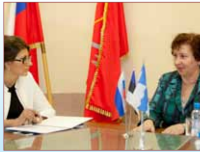
Lk 2 Reis St Peterburi - kogemuste vahetamine hariduse ja tervishoiu valdkonnas.