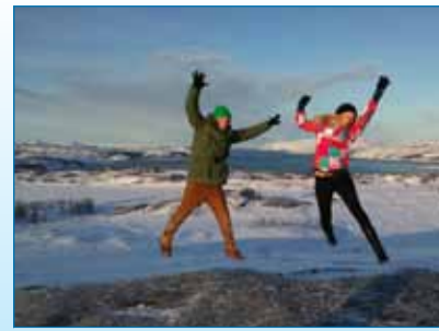
Lk 4 Sikupilli kooli õppereis viis Põhja-Norrassa vastu Venemaa piiri.