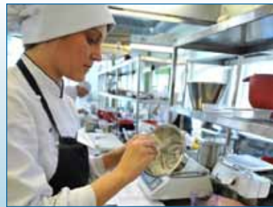
Lk4. Võistlus Noorus- lik Kevad 2012 Tallinna Teenin- duskoolis