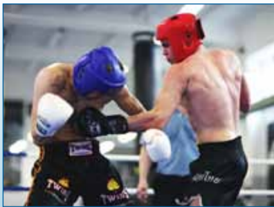
Lk4. Lasnamäe klubi Garant - tugevaim Eesti K-1 klubi