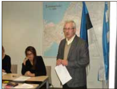
Lk3. Karid korteriühistu üldkoosolekul